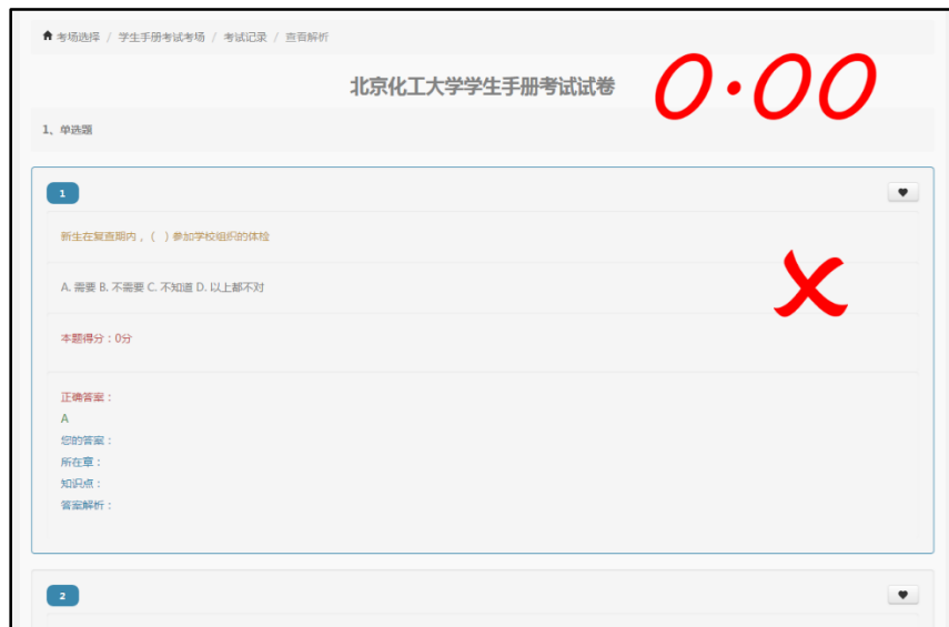
图 5 查看答案或解析界面