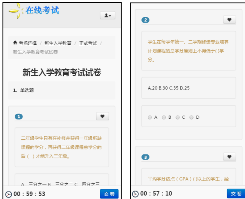
图 9.4 正式考试界面