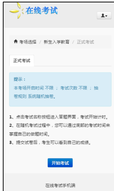
图 9.3.2 考场信息确认