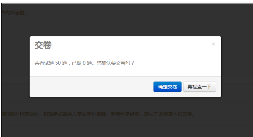
图 4.2.1 交卷提示信息

点击交卷按钮，系统将出现确认对话框。交卷为不可逆的操作，一旦选择后将无法继续答题。