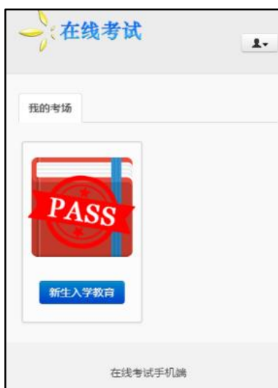
图 9.9 考试完成界面

当考试合格后，考生再次进入在线考试系统手机端首页时，将看到“PASS”图章，表示该考生已经通过考试，且不能再次进入考试界面。