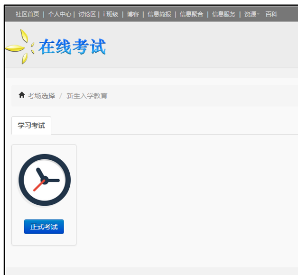
图 3.2 考试信息确认界面