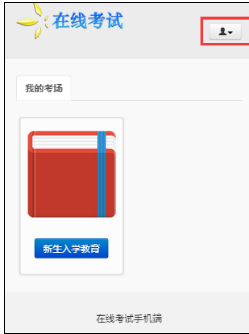
图 9.2 在线考试手机端首页