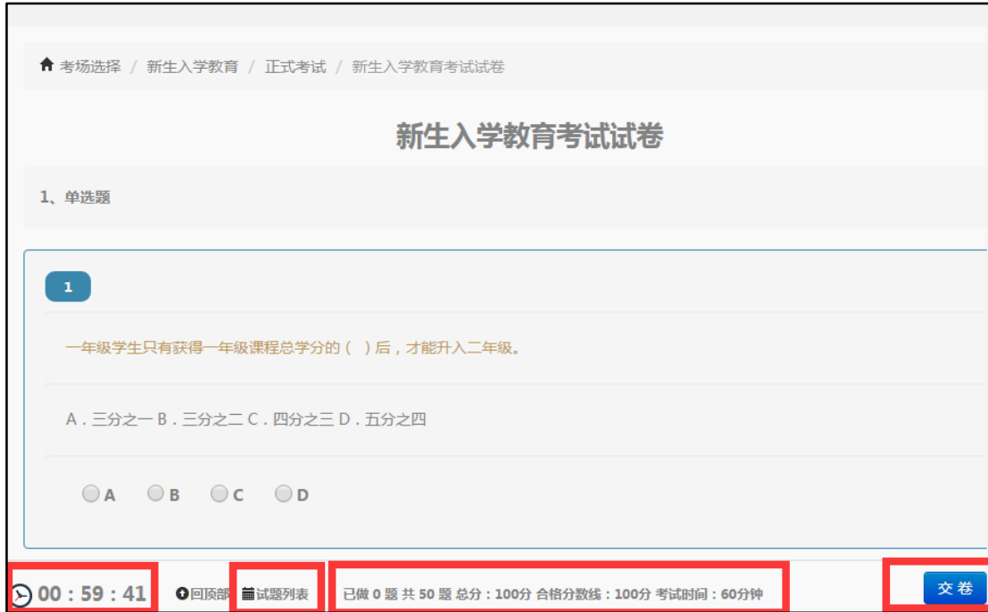
图 3.4 正式考试界面