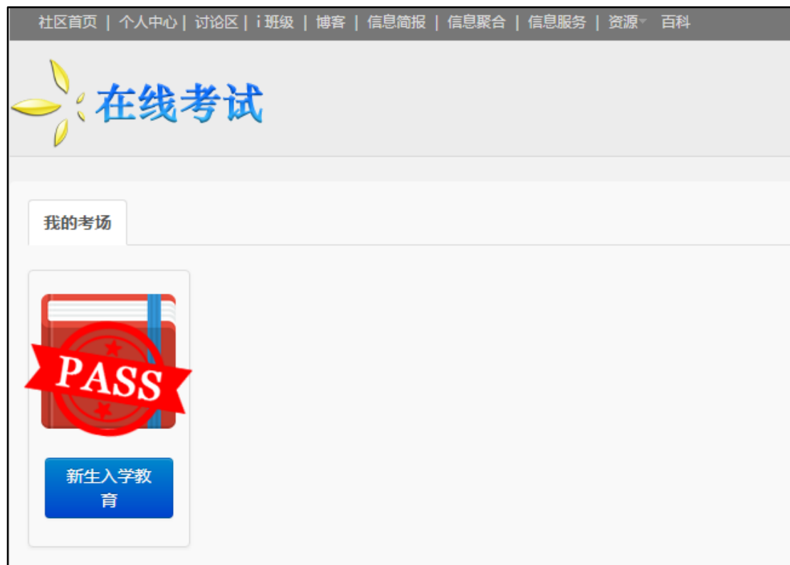
图 8 考试完成界面

当考试合格后，考生再次进入在线考试系统首页时，将看到“PASS”图章，表示该考生已经通过考试，且不能再次进入考试界面。