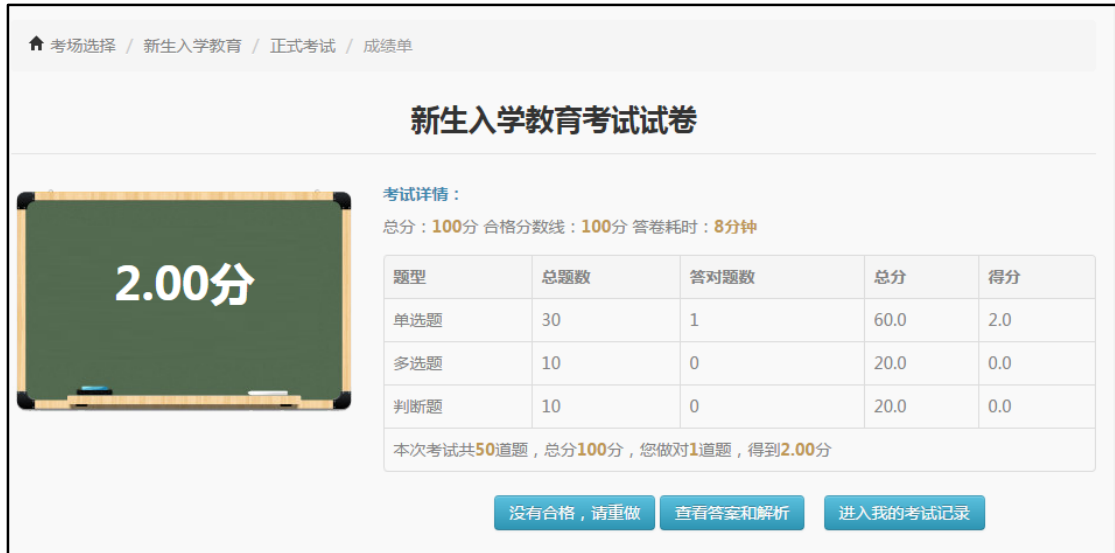
图 4.3 考试结果

提交试卷后将直接显示考试分数。考试合格提示您“恭喜您，完成考试”；考试不合格提示“没有合格，请重做”；无论考试是否合格，均可“查看答案和解析”以及“进入我的考试记录”。