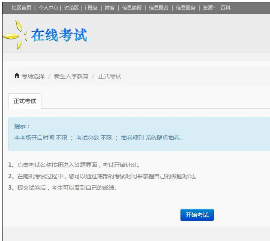
图 3.3 考场信息确认