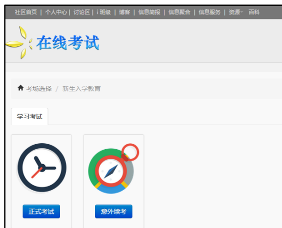
图 7 意外续考

考试系统将用户未完成考试的答题记录进行本地存储，如遇浏览器突然崩溃或意外关闭、电脑死机或意外重启等情况，重新打开浏览器直接访问在线考试网址 http://i.buct.edu.cn/exam/ 尝试续考，请勿重新登录，也尽量不要访问其它版块，否则意外续考数据可能会恢复失败。