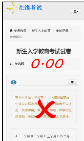
图 9.7 查看答案和解析