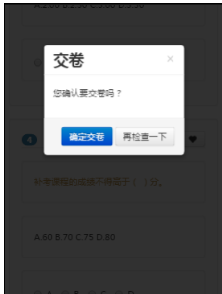
图 9.5 交卷信息确认对话框

考试交卷分为自动交卷和手动交卷，考试时间结束系统将进行自动交卷，点击交卷即可弹出交卷信息确认对话框。