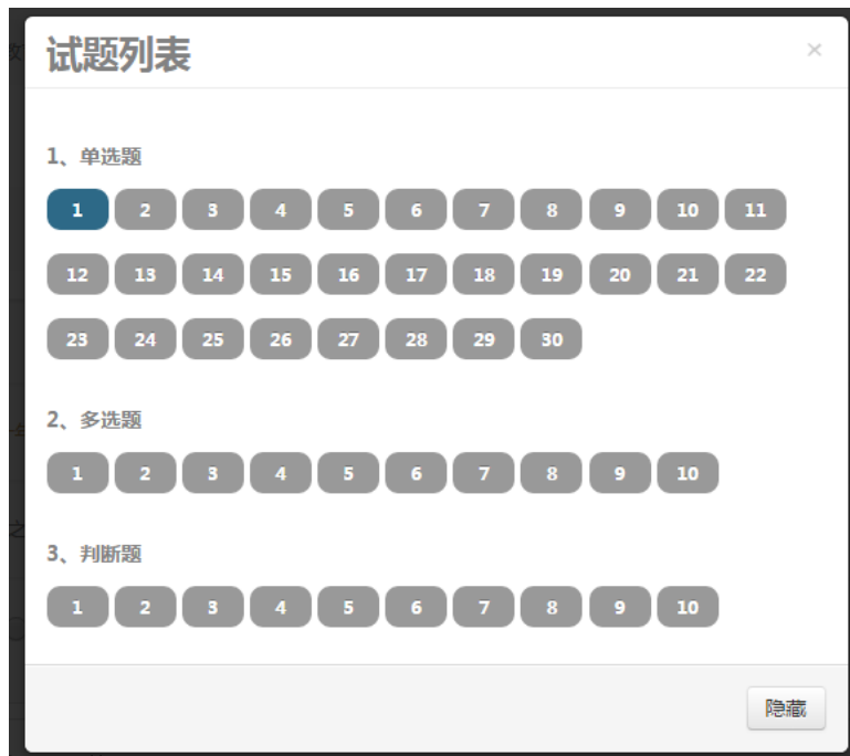
图 3.5 试题列表

点击页面底部操作区的“试题列表”，弹出试题列表对话框，已完成题目的显示为蓝色，未完成题目显示为灰色，点击题号可直接跳转到试题所在位置。