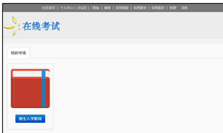
图 3.1 考场选择