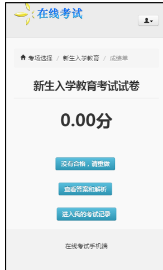
图 9.6 成绩单

考试合格提示“恭喜您，完成考试”；考试不合格提示“没有合格，请重做”， 击可重做试卷；无论考试是否合格，都可“查看答案和解析”及“进入我的考试记录”。