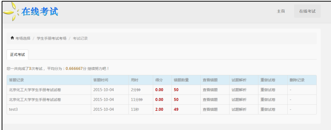
图 6 考试记录

考试完成后点击“进入我的考试记录”，将显示该账号所有考试记录，可查看错题及试题解析，点击“重做试卷”将重新开始考试。